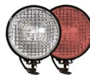
фары на СИМ